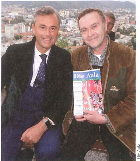
Die Aula bei Hofer: auf Du und Du

Hofer posiert im November 2016 für ein Werbefoto für das rechtsextreme und neonazinahe Magazin „Aula“. In der „Aula“ wird auch mehrfach in Inseraten des FPÖ-Bildungsinstituts ein Buch von Hofer beworben.